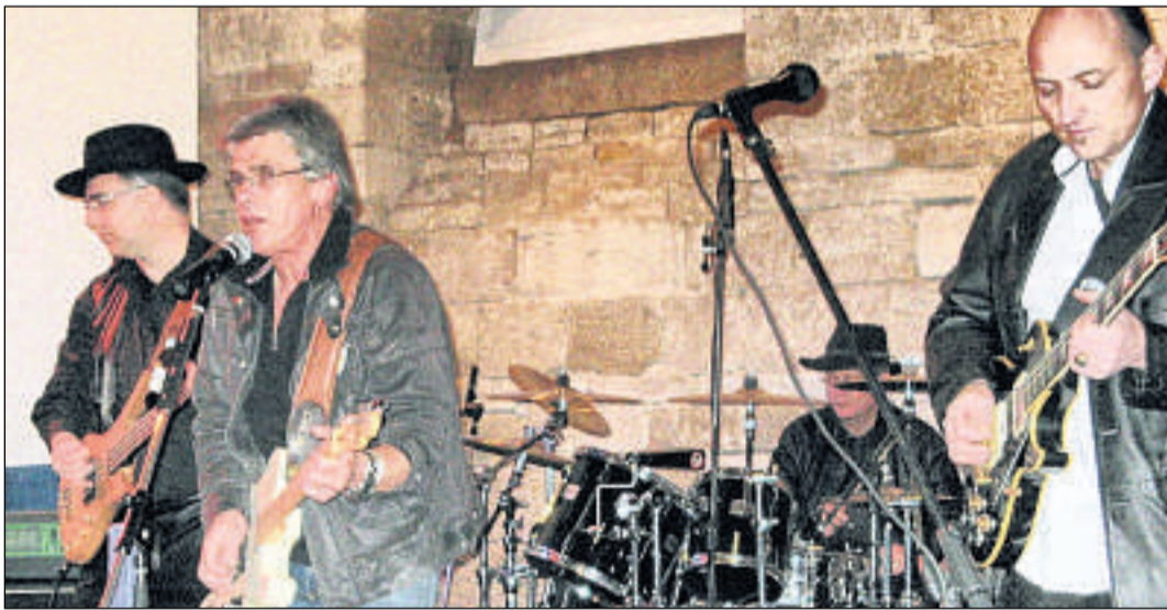
Heiße Rhythmen für den guten Zweck: Albatros rockt Spendengelder locker.

Kein Wunder, denn die Stimmung war hervorragend. Bei Rockmusik der 60er-, 70er- und 80er-Jahre war von der recht frischen Temperatur im alten Gemäuer nichts zu spüren. Denn schon die ersten Klänge motivierten zum mit-