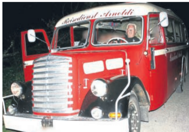
Alternative für Fußgänger: ein historischer Reisebus vom Typ Opel Blitz, Baujahr 1936.