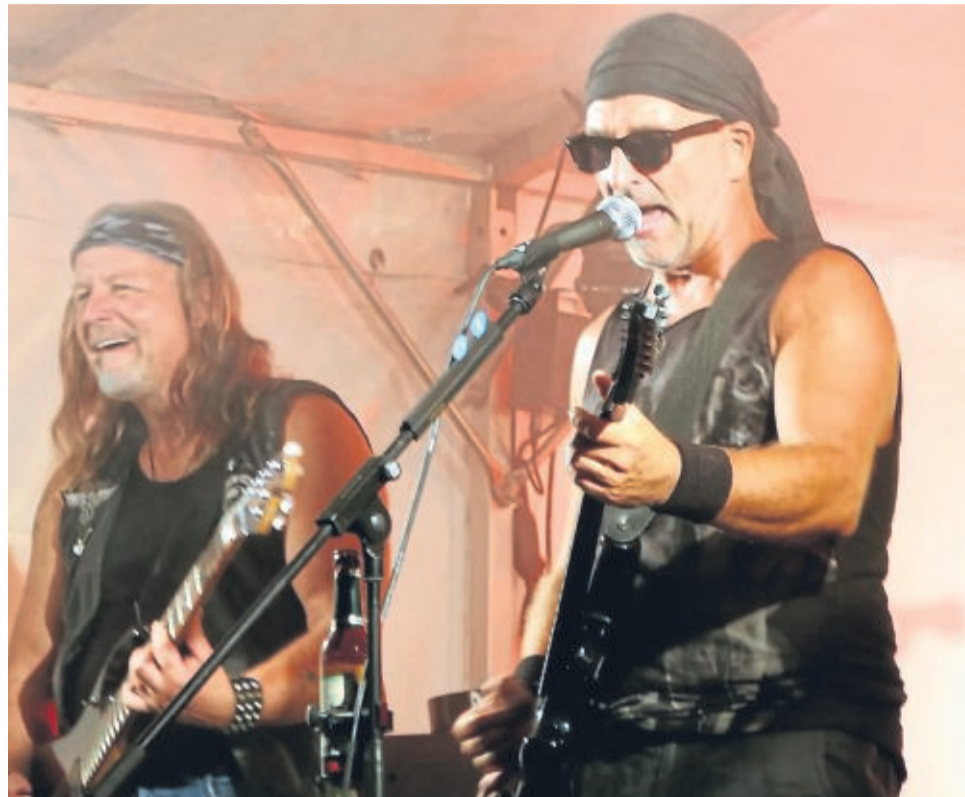
Heizten dem Publikum ordentlich ein: Mitglieder der Göttinger Rockband Jigsaw.

Ein wichtiges Anliegen neben dem Erhalt des Denkmals ist die Unterstützung und Förderung junger, regio-