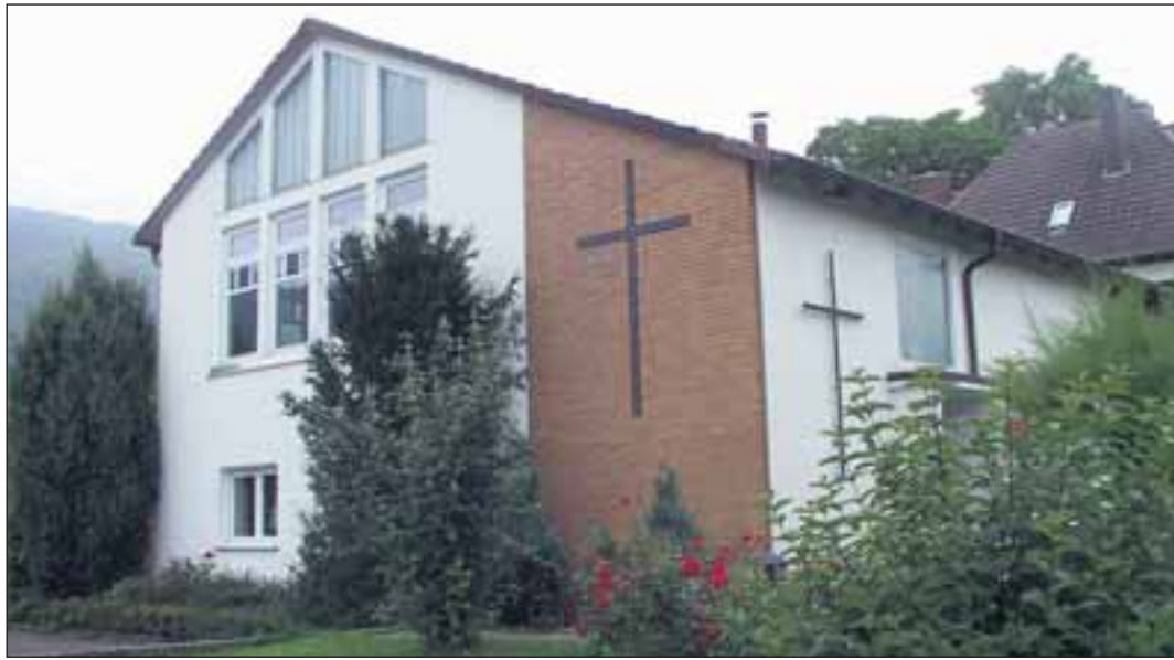
Die Kirche der Evangelisch-Freikirchlichen Gemeinde steht Hinter der Blume 35.

Spätnachts ist eine Lichterwanderung zur St. Blasius-Kirche geplant.