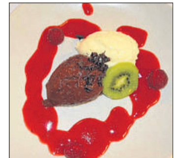
Süßes nach der Gans: Mousse au Chocolat dunkel und weiß mit Himbeeren, Kiwis, Erdbeersoße und dunklen Schokoladenraspeln.

fung und Verhinderung von Armut, Ausgrenzung und Isolation in Hann. Münden und allen Ortsteilen gefördert. Es wird dort geholfen, wo der Staat und öffentliche Einrichtungen nicht mehr helfen. Es werden keine Projekte für einzelne Menschen unterstützt und auch keine Dauerfinanzierungen übernommen. Die finanzielle Förderung durch das Spendenparlament ist eine einmalige Anschubfinanzierung oder eine Überbrückung. (zpy)