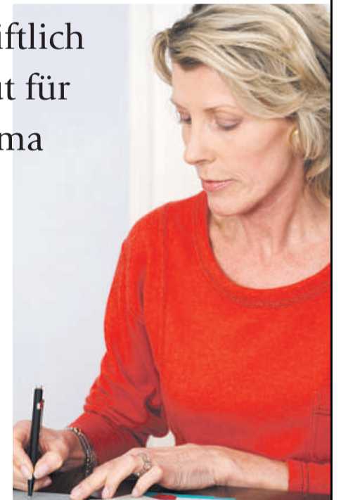
Eine von 644 Frauen beantwortet die schriftliche Umfrage

Allensbacher Archiv, IfD-Umfrage 10023, April 2014